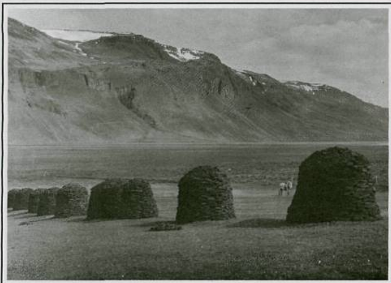
Mynd 6 Móhraukar.

Nú er þessu starfi lokið að móverka og allir þeir sem þar störfuðu farnir að hvíla sig. Og margir búnir að fá þá eilífu hvíld. Nú þarf ekki að erfiða lengur við móinn