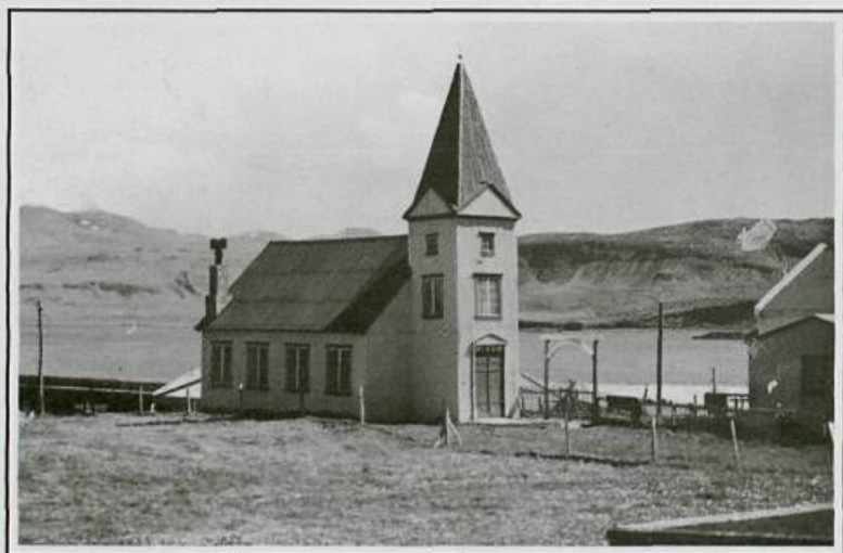
Mynd 8. Ólafsvíkurkirkja var vígð 26. mars 1893 og stendur hún enn.