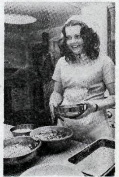
Lært að matbúa.