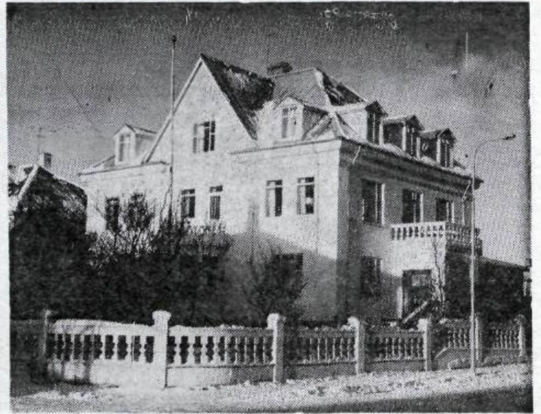
Húsmæðraskóli Reykjavíkur hefur ávallt verið í fallegu, gömlu húsi við Sólvallagötu.