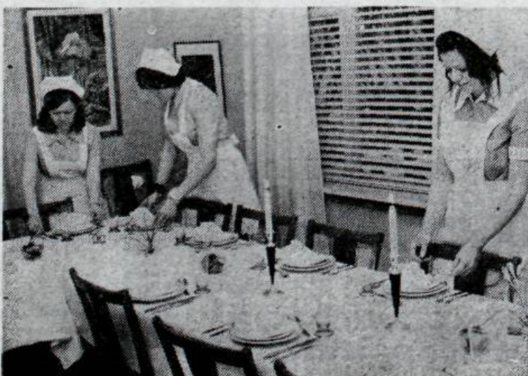
Nemendur að leggja á borð fyrir veizlu.

HÚSMÆÐRASKÓLI Reykjavíkur er 30 ára; var settur 7. febrúar 1942. Frá upphafi hefur skólinn verið þéttsetinn og stundum næstum ofsetinn og hefur 5341 stúlka stundað þar nám.