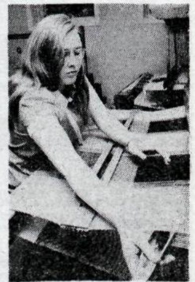
Setið við vefinn.