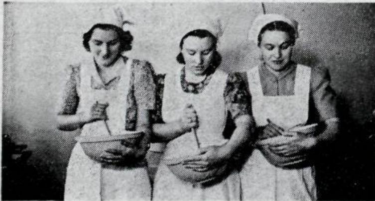
Á fyrsta skólaárinu voru kökur hrærðar í höndunum.