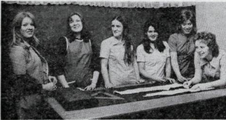
Fyrst þarf að sniða flikina.