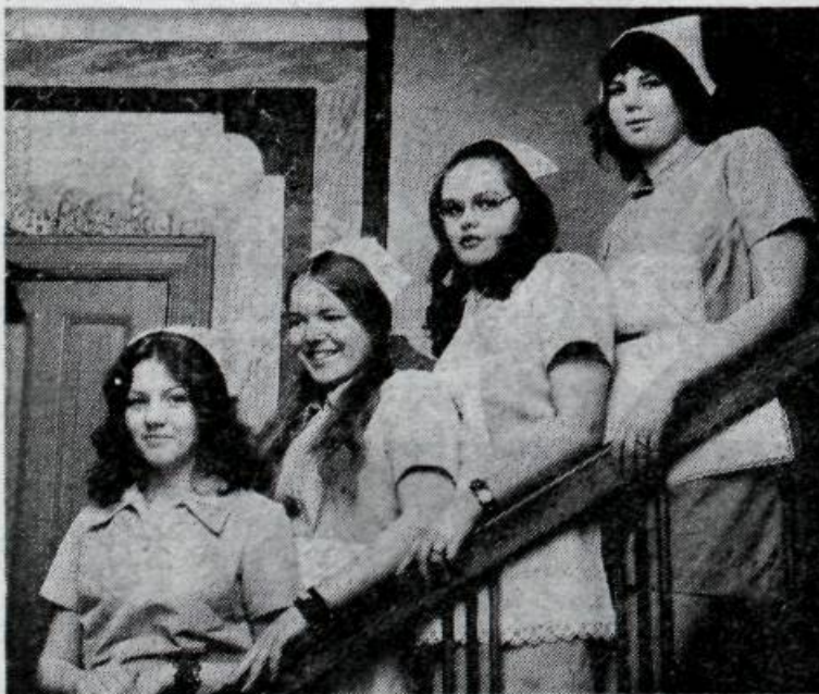
Þessar fjórar voru að ljúka við að hreinsa utan dyra, þegar smelli var á þær mynd í stiganum í anddyrinu.