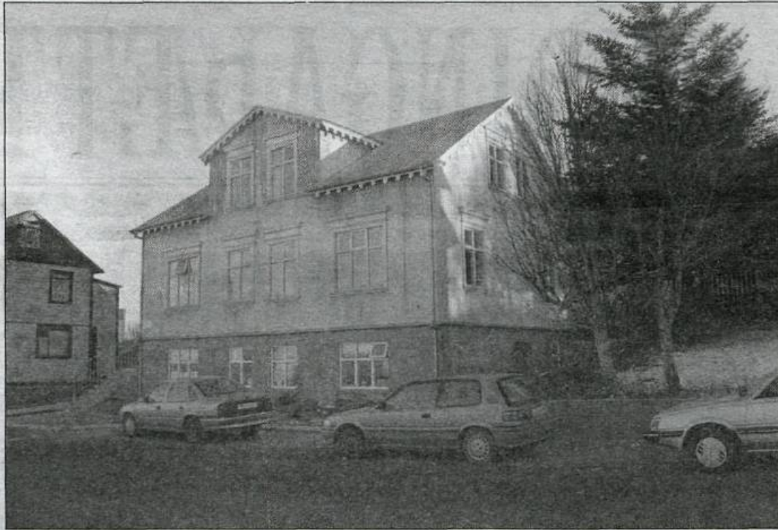
Sýslumannshúsið stendur enn við Suðurgötu, en nú er það númer 8 og er á uppsteyptum kjallara. Upphaflega stóð húsið handan götunnar.

Páll Einarsson var sýslumaður í Barðastrandarsýslu á árunum 1893 til 1899, borgarstjóri í Reykjavík frá 1908 til 1914, síðan sýslumaður Ey-