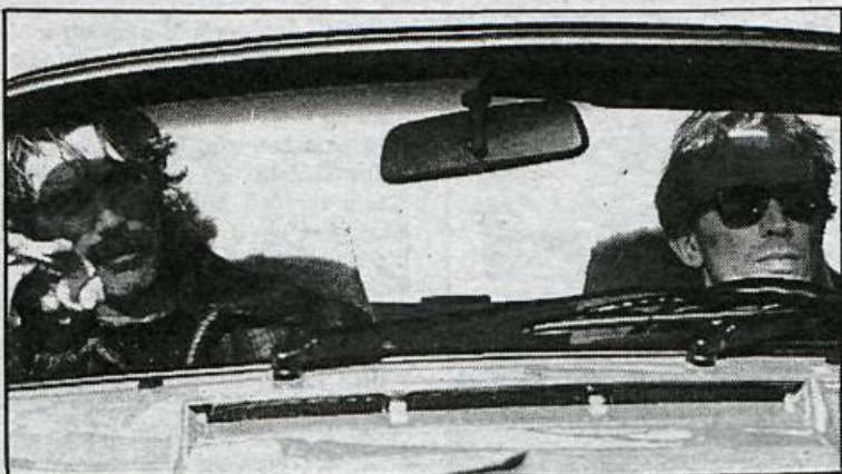
Sam Elliott og Peter Weller í Uppgjörinu sem sýnd er í Laugarásbíói.