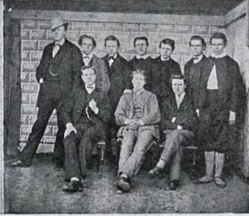
4. bekkur síðari deild.