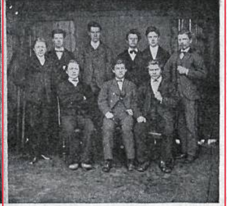
3. bekkur B.