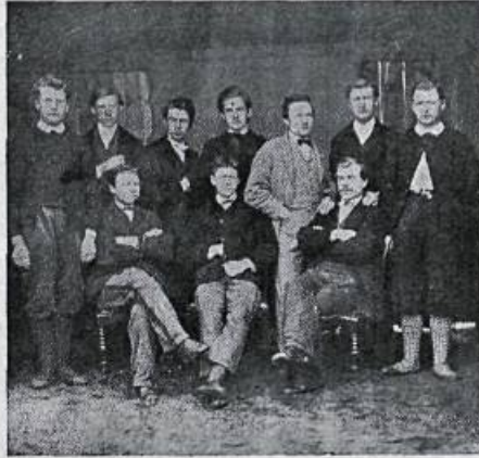
4. bekkur fyrri deild.