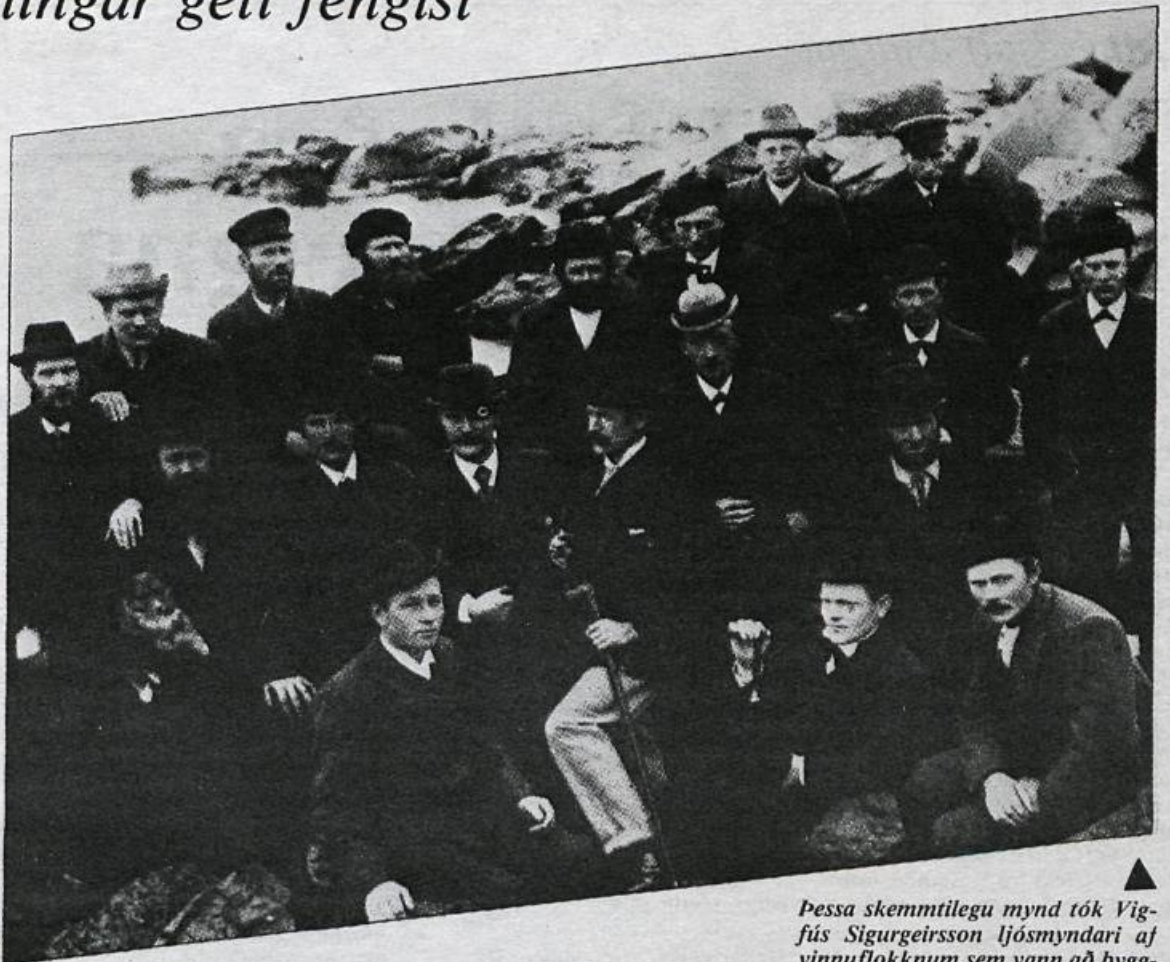
Þessa skemmtilegu mynd tók Vigfús Sigurgeirsson ljósmyndari af vinnuflokknum sem vann að byggingarframkvæmdum í Austurstræti 11 rétt fyrir aldamót.

Landsbankinn hafði ekki haft heimild til seðlaútgáfu. Hinsvegar var gert ráð fyrir að hinn nýi hlutabanki hefði einkarétt til seðlaútgáfu í 30 ár. Þessi banki var stofnaður 25. september 1903 í Kaupmannahöfn og nefndur Íslandsbanki. Til að bæta nokkuð úr fjármagnsskortri Landsbankans hafði seðlaútgáfa Landsþjóðs verið aukin um 250 þús. kr. á árinu 1900, og ár-