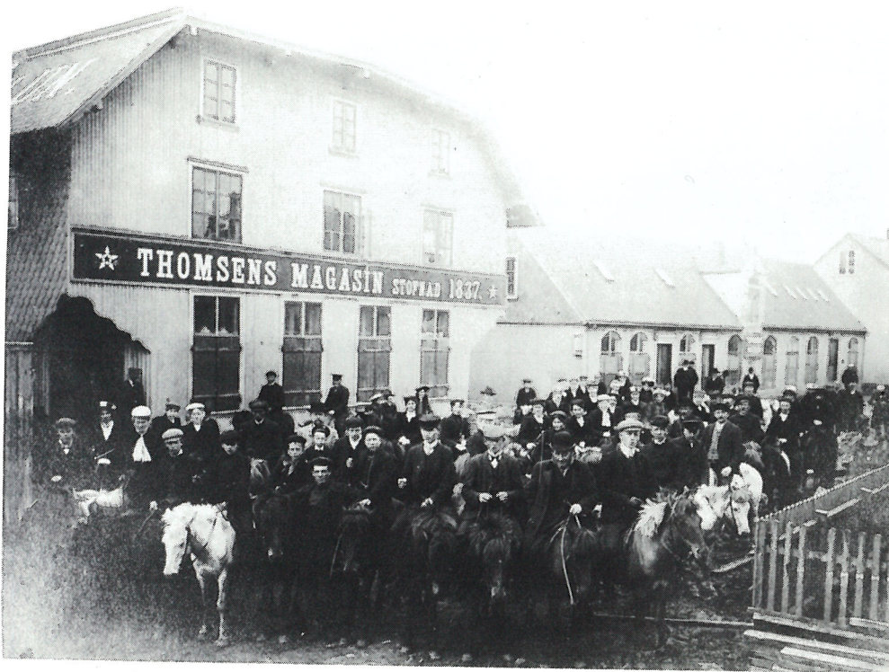
Thomsens-magasín og Smithsbúð. Fyrir framan verslunina er hópur manna, sennilega bæjarbúar að fara í skemmtiferð.

sensbryggja, Smithsbryggja og svo framvegis. Milli bryggjana var svo bátauppsátur, aðallega róðrabáta.