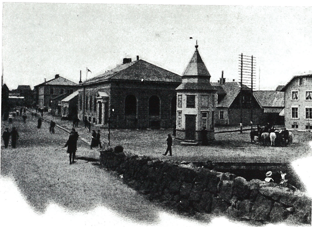
Íslandsbanki séður frá Bankastræti. Mynd úr ferðabók Inu von Grumbkow: Ísafold. Reisebilder aus Island. Berlin 1909. Bls. 26.

Háttvirtir fundarmenn mega ekki vænta þess af mér að heyra hér í kvöld vísindalegan fyrirlestur um verslun né heldur tæmandi lýsingu á verslunar-ástandinu, eins og það var hér í bæ fyrir um hálfri öld, eða kringum 1870.