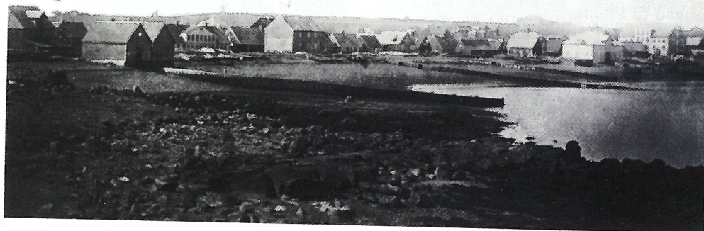
Nokkrar uppskipunarbyggjur í fjörunni í Reykjavík um miðja síðustu öld. Fremst á myndinni er Siemensbyggja, þá Bæjarbyggja, norður af núverandi Pósthússtræti, þar sem Steinbyggjan kom síðar. Næst kemur Knudzonsbyggja og loks Duusbryggja fyrir framan Bryggjuhásið. Lengst til hægri sést stórhýsið Glasgow og Sjöbúð.

Ég drap á það áður, að konur voru látnar bera hálfunnupoka á bakinu. Allur vinnumáti við verslanirnar hér var ógurlega frumstæður fyrir hálfri öld og jafnvel þótt skemur sé farið aftur í tím-