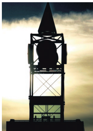
KLUKKUTURNINN Á GARÐATORGI

Miðtími Greenwich er alþjóðlegur staðaltími sem miðaður er við Greenwich núllbaug en hann liggur í gegnum Konunglegu stjörnuskoðunarstöðina í Greenwich í Englandi. Á alþjóðlegu núllbaugsráðstefnunni árið 1884 ákváðu öll lönd heimsins meðal annars að taka upp samræmdan staðartíma og á staðarvalið á Greenwich rætur sínar að rekja til þeirrar ráðstefnu.