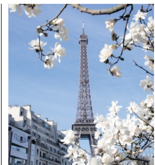
PARIS SKARTAR SÍNU FEURSTA Vorið hefur hafið innreið sína í þessa höfuðborg rómantíkurinnar.