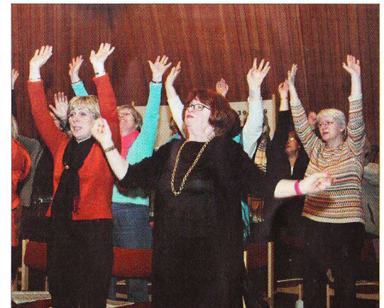
Svipmyndir frá æfingum á Requeim